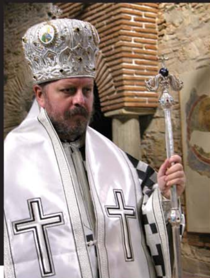
Митрополит Струмички г. Наум